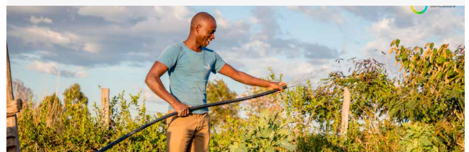
les petits producteurs ont la clé de la sécurité alimentaire mondiale. Ici, un ingénieur SunCulture présente l'un de ses produits en action.